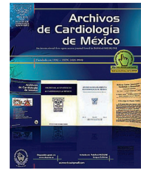
IMAGEN EN CARDIOLOGÍA