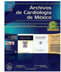
IMAGEN EN CARDIOLOGÍA