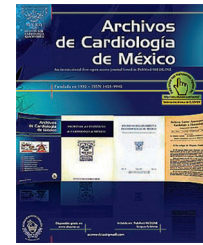
IMAGEN EN CARDIOLOGÍA