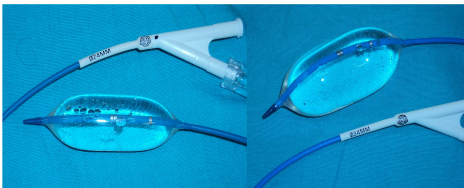
Figura 1 Balones percutáneos de medición de comunicación interauricular; 24 mm de diámetro para la cava superior y 34 mm para la cava inferior.