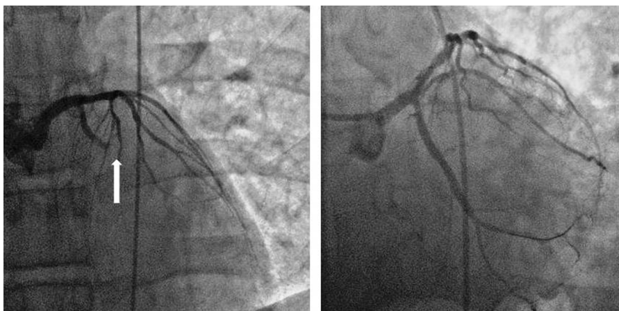
Figura 2 Oclusión trombótica de la arteria circunfleja proximal (flecha) y resultado angiográfico final tras la angioplastia.

Las guías actuales de práctica clínica recomiendan el uso de ticagrelor o prasugrel sobre el clopidogrel en los pacientes con IAMCEST excepto si hay alguna contraindicación, y no aconsejan el uso de ticagrelor asociado a AAS en la fibrinólisis 1 . La administración de ticagrelor más AAS versus clopidogrel más AAS en los pacientes con IAMCEST sometidos a IPC primaria redujo en forma significativa la tasa de eventos cardiovasculares y aumentó la supervivencia