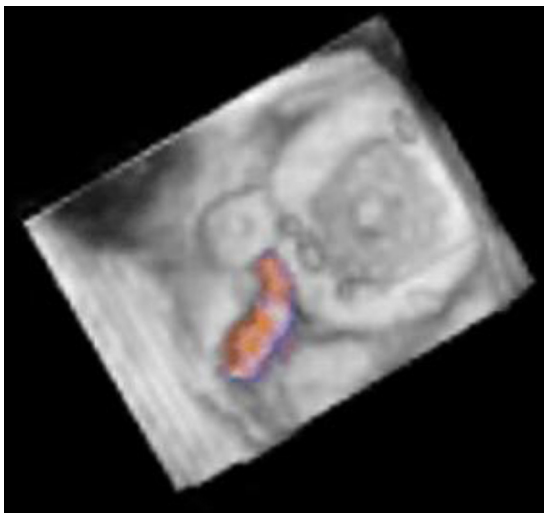
Figura 1 Imagen de ecocardiograma transesofágico tridimensional de la prótesis valvular mecánica en posición mitral en sístole ventricular. Se observa la válvula mecánica cerrada, el Amplatzer® Duct Occluder (St. Jude Medical) previamente colocado y la fuga paravalvular residual demostrada por doppler color.

Presentamos la imagen ecocardiográfica transesofágica tridimensional del resultado exitoso de cierre percutáneo de una fuga paravalvular mitral residual con un dispositivo Amplatzer® Vascular Plug III (St. Jude Medical), después del procedimiento inicial de cierre percutáneo con dispositivo Amplatzer® Duct Occluder (St. Jude Medical). Varón de 64 años con antecedente de cambio valvular mitral por prótesis mecánica St. Jude hace 4 años y fuga paravalvular importante a los 4 meses del evento quirúrgico, por lo que fue cerrada en forma percutánea con un dispositivo Amplatzer® Duct Occluder (St. Jude Medical), persistiendo la fuga paravalvular residual ligera (fig. 1). Durante el seguimiento de 2 años ingresó varias veces en urgencias