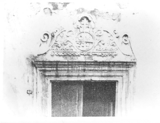
Figura 1 La doble cruz, símbolo de la afiliación al archihospital romano de Santo Spirito, en la fachada de la iglesia del Hospital de San Juan de Dios, en Pátzcuaro, Mich.

Los hospitales americanos surgieron con características semejantes a las de los nosocomios europeos de la Edad Media y al mismo tiempo con rasgos de las ideas más avanzadas de su tiempo 1 . El primer hospital americano se inauguró el 29 de diciembre de 1503 en la Isla de Santo Domingo: Hospital de San Nicolás de Bari, fundado por el entonces gobernador Nicolás de Ovando, perteneciente a la Orden Militar de Alcántara. Este hospital consiguió, en 1541, su filiación al archihospital romano de Santo Spirito, así como la obtuvieron otros hospitales mexicanos y peruanos. Aún pueden verse sobre las fachadas de las iglesias de dichos hospitales los emblemas de su filiación: la doble cruz y un símbolo del Espíritu Santo (fig. 1). A su vez, el primer hospital de la América continental fue el de la Inmaculada Concepción, creado en México por Hernán Cortés en el año 1524 2 . Tenía una configuración en «T» como el de Santiago de Compostela, diseñado por el arquitecto Enrique Egas a fines del siglo xv. Tal vez Cortés, quien se ocupó personalmente del proyecto del edificio, tuviera presente aún el archihospital romano de Santo Spirito, reconstruido entre 1473 y 1476 con una planta en forma de «tau».