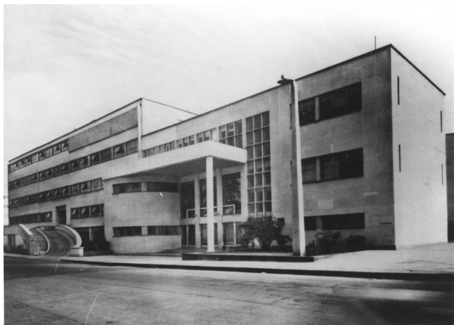
Figura 3 El primer Instituto Nacional de Cardiología de México 1944-1976.

un limitado sector de objetividad. Es, por ende, una ciencia particular. Cada una, en el desenvolvimiento de su plan por el método correspondiente, debe especializarse en un dominio bien circunscrito. Por consiguiente, la especialización y la superespecialización no constituyen de ninguna manera un mal necesario, porque se desprenden de la exigencia esencial de la ciencia, que es una investigación. Es incorrecto decir que la investigación no es un movimiento organizado por el hecho de que su quehacer se realiza en diferentes instituciones. Estas son indispensables porque la ciencia, como investigación, tiene el carácter intrínseco de un movimiento de aprovechamiento organizado. Tal carácter permite a las ciencias lograr su cohesión y su unidad propia. En efecto, la ciencia se basa y al mismo tiempo se especializa en planes de sectores determinados de objetividad, planes que se desenvuelven en el procedimiento correspondiente, garantizados por el rigor. Dicho procedimiento se organiza en movimientos de explotación o, mejor dicho, de utilización metódica en centros de investigación. Es esta «el apetito de conocimiento y el fin de la investigación es el descubrimiento...» 7 . Por eso la especialización, nos recuerda Heidegger 8 : «es una consecuencia necesaria y positiva del ser de nuestra ciencia».