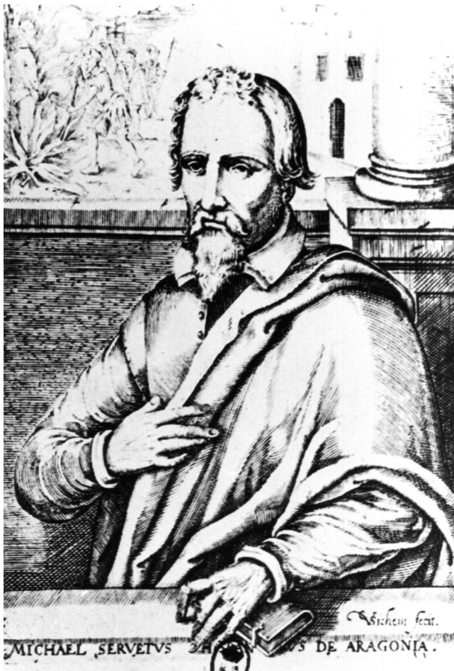
Figura 2 Miguel Servet (1511-1553).