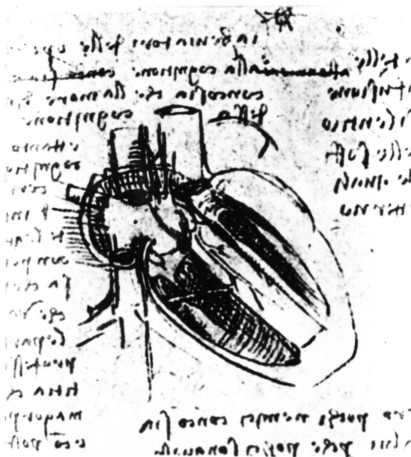
Figura 1 Esquema de un corazón abierto (dibujo de Leonardo da Vinci).

abanderado de los pioneros de la anatomía científica y tuvo la valentía de criticar los puntos de vista erróneos de Galeno en forma más decidida que el propio Vesalio 17 . No publicó ninguna obra monumental ni se preocupó mucho de la representación gráfica de las piezas anatómicas, pero fue el más cuidadoso investigador de la anatomía, indefessus magnus inventor en palabras de von Haller. Sus contribuciones más significativas consisten en el estudio del oído, la rectificación del trayecto de las arterias cerebrales, que en opinión de Vasalio se originarían en el seno, la descripción de las trompas uterinas, de los músculos oculares y de los nervios encefálicos. Su obra principal « Observationes anatomicae » (1561) 18 , junto con los tratados anatómicos de Juan Valverde de Amusco y de Realdo Colombo, se hallaban en la llamada Biblioteca Turriana de México 19 . Laín Entralgo 20 afirma que inició Falloppio la morfología genética y la estequiología biológica moderna y fue el verdadero forjador de la noción de «tejido».