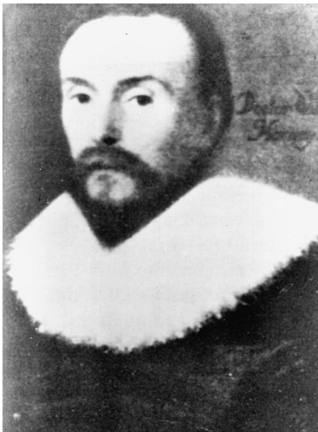
Figura 4 William Harvey (1578–1657).

torácico en el perro y en el hombre y se descubrieron los vasos linfáticos independientemente por Olof Rudbeck (1630–1702), Thomas Bartholin (1616–1680) y George Joyliffe (1621–1658).