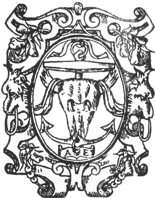
Figura 1 Primera marca tipográfica en la Nueva España por Antonio de Espinosa (1566).

Otra serie de viñetas se refiere a las marcas tipográficas de impresores antiguos desde Giovanni Angelo Scinzezeler (Milán, 1505) a Paolo Manuzio (Venecia, 1555), los hermanos Froben de Basilea (primera mitad del siglo xvi) y Michael Sonnino (París, 1580). Entre estas viñetas figura la primera marca tipográfica (fig. 1) introducida en la Nueva España por el español Antonio de Espinosa, antiguo colaborador del impresor italiano Juan Pablos (Giovanni Paoli), en 1566. Asimismo está la marca tipográfica de Ludwing Elzevirius o Elzevier (Leiden, 1595) (fig. 2), uno de los fundadores de la Casa Elzevier, todavía activa y próspera en nuestros días. Parece justo mencionar asimismo el colofón de la Rethorica Christiana del tlaxcalteca fray Diego Valadés OFM, primer libro de un autor americano impreso en Europa, específicamente en la ciudad italiana de Perusa, el año 1579.