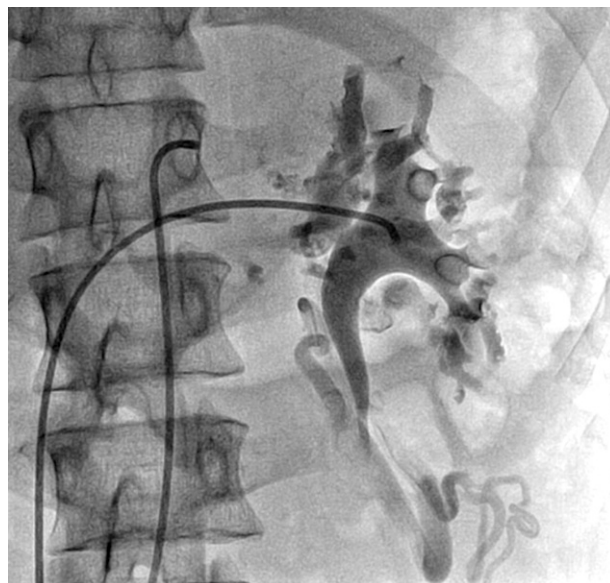
Figura 3 Flebografía selectiva de la vena renal izquierda en proyección posteroanterior, que muestra congestión venosa con importantes vasos colaterales y dilatados.

derecha, inicialmente de las arterias aorta y mesentérica superior, ambas sin lesiones angiográficas, posteriormente por flebografía se identificó compresión extrínseca de la vena renal izquierda con vasos varicosos (fig. 3); se documentó un gradiente cavo-renal de 7 mmHg, se decidió realizar angioplastia periférica con implante de stent autoexpandible de nitinol en la vena renal izquierda, se colocó un introductor largo y curvo 9F, se avanzó el sistema de liberación Amplatzer ToqVue® 45°, ya una vez posicionada una guía Amplatzer super Stiff® 0.035 x 260 cm, se avanzó un stent autoexpandible Sentinol Biliar® 9 x 42 mm con adecuado resultado angiográfico, asimismo sorprendió la reducción importante de la circulación colateral y finalmente, se evaluó el gradiente medio cavo-renal que se reduce a 0 mmHg, con lo que se concluyó el procedimiento como exitoso y sin complicaciones (fig. 4).