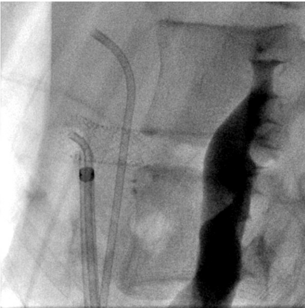
Figura 4 Proyección lateral, que muestra el resultado final del stent autoexpandible con adecuada apertura del mismo.