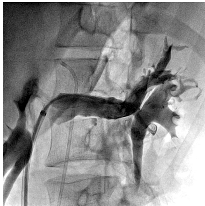
Figura 5 Flebografía selectiva de la vena renal izquierda con excelente resultado angiográfico y franca disminución de la circulación colateral y congestión venosa.

En nuestro caso, el dato clínico inicial fue la hematuria y leve proteinuria, lo cual fue estudiado y se descartó cada uno de los diagnósticos diferenciales como litiasis, malformaciones congénitas vasculares, tumores, infecciones, anomalías del parénquima o de la vía urinaria, entre otras. Se debe enfatizar que la primera herramienta diagnóstica es la semiología y la exploración física, si el paciente tiene síntomas de congestión pélvica y hematuria, la asociación de dolor en el flanco izquierdo con irradiación al área glútea, disconfort pélvico y várices pélvicas en una mujer, o varicocele en el varón, constituyen una fuerte base en el diagnóstico 6,12,13 . El apoyo de imagen con la TC y el US Doppler utilizados en este caso nos permitieron establecer el diagnóstico y pusieron de manifiesto las alteraciones vasculares venosas secundarias a la persistencia de la hipertensión venosa, si bien el diagnóstico puede sospecharse por Dop-